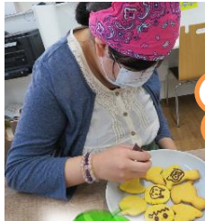
ハロウィンはお菓子を作りました